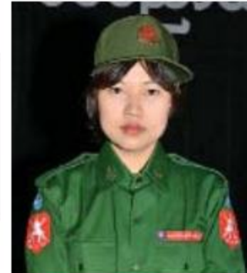
စိုးစိုးမိုးမိုး