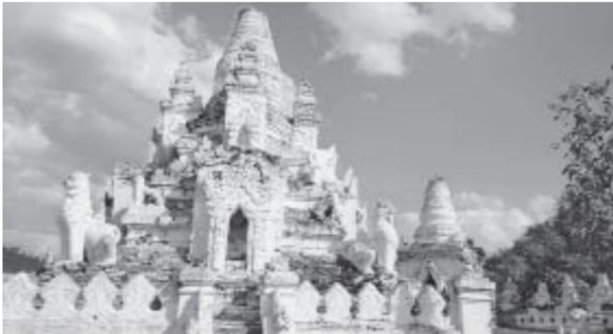
ရှားတောမြို့ရှိ ဘီလူးမတောင်စေတီတော်ကို တွေ့ရစဉ်။

လွိုင်ကော် ဖေဖော်ဝါရီ ၁၄ ကယားပြည်နယ် ရှားတောမြို့၏ အထင်ကရရှေးဟောင်းစေတီတော်အချို့မှာ ချဲ့နွယ်ပိတ်ပေါင်းများ ဖုံးအုပ်၍ ပျက်စီးယိုယွင်းနေပြီဖြစ်သဖြင့် သမိုင်းအမွေအနှစ်များ ဆုံးရှုံးပျောက်ကွယ်သွားမှုမဖြစ်ပေါ်စေရေး ရှေးမှုပပျက်ပြန်လည်ပြုပြင်မွမ်းမံ