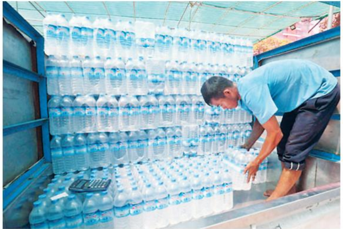
A worker loading water bottles onto a truck.