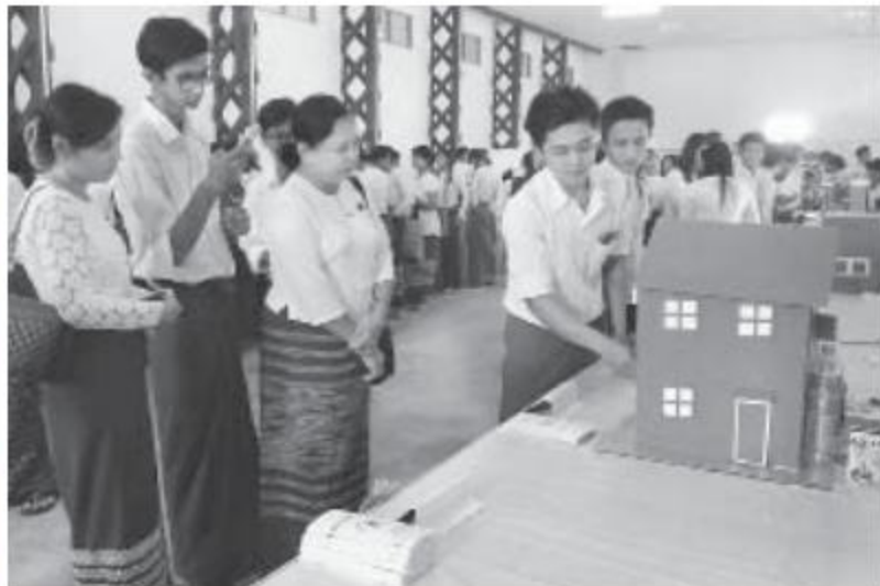
ထားဝယ် ဖေဖော်ဝါရီ ၁၄ နည်းပညာထုတ်ကုန်ပြပွဲအခမ်းအနားကို ယမန်နေ့ နံနက် ၁၀ နာရီ မိနစ် ၂၀ က တနင်္သာရီတိုင်းဒေသကြီး ထားဝယ်မြို့ ကွန်ပျူတာတက္ကသိုလ်ခန်းမ၌ ကျင်းပသည်။

အခမ်းအနားတွင် တနင်္သာရီတိုင်းဒေသကြီးလွှတ်တော်ဥက္ကဋ္ဌ ဦးခင်မောင်အေးနှင့် ကွန်ပျူတာတက္ကသိုလ်တာဝန်ခံ ဒေါက်တာသိန်းနိုင်တို့က နည်းပညာထုတ်ကုန်ပြပွဲကို ဖဲကြိုးဖြတ်ဖွင့်လှစ်ပေးပြီး တိုင်းဒေသကြီးလွှတ်တော်ဥက္ကဋ္ဌ၊ ဒုတိယဥက္ကဋ္ဌ ဦးကြည်စိုး၊ ဌာနဆိုင်ရာတာဝန်ရှိသူများ၊ ကွန်ပျူတာတက္ကသိုလ်တာဝန်ခံနှင့် ဝန်ထမ်းများက ကွန်ပျူတာနှင့်သက်ဆိုင်သော Hardware၊ Software၊ IT Products များကို ကြည့်ရှုအားပေးသည်။ ပြပွဲတွင် ကွန်ပျူတာတက္ကသိုလ်(ထားဝယ်)၏ ဒုတိယနှစ်သင်တန်းမှ ပဉ္စမနှစ်သင်တန်းအထိ သင်တန်းအသီးသီးမှ ကျောင်းသား၊ ကျောင်းသူများက Software Products ၁၁ ခု၊ Hardware Products ၁၁ ခုတို့ကို ပြသပေးခဲ့ကြောင်း သိရသည်။ ကျော်ကျော်လတ်(ထားဝယ်)