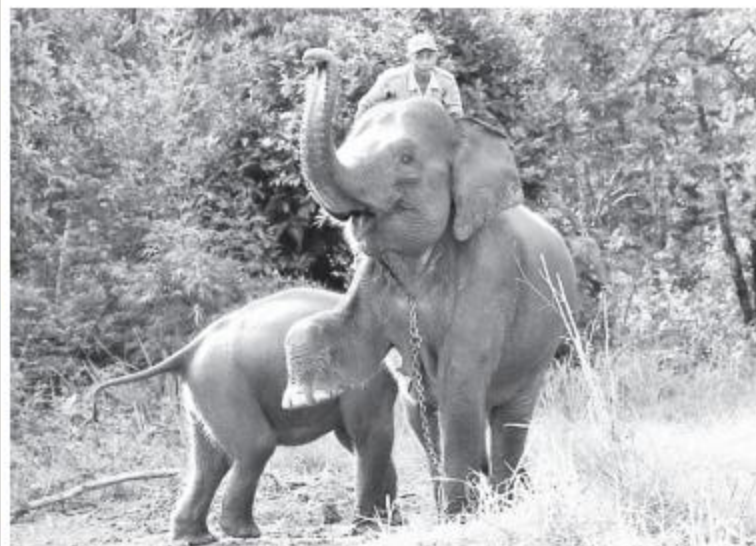
A ranger stop a patrol elephant with her calf in Way Kambas National Park in 2016: a Sumatran elephant has been found dead there with apparent bullet wounds.