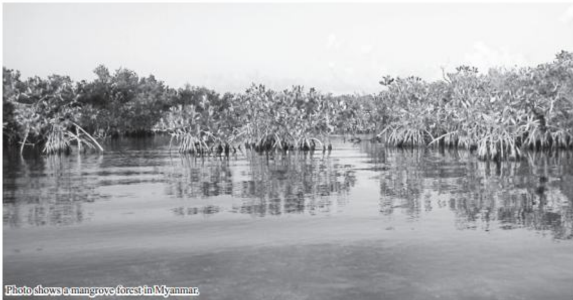
Photo shows a mangrove forest in Myanmar.