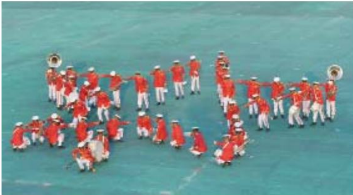
နေပြည်တော်တိုင်းစစ်ဌာနချုပ်ကိုယ်စားပြု အမှတ်(၁)တပ်ခွဲစစ်တီးဝိုင်းအသင်း ယှဉ်ပြိုင်စဉ်

နေပြည်တော်၊ ဖေဖော်ဝါရီ ၁၄ (၇၃)နှစ်မြောက် တပ်မတော်နေ့အထိမ်းအမှတ် (၂၅)ကြိမ်မြောက် တပ်မတော်(ကြည်း၊ ရေ၊ လေ)စစ်တီးဝိုင်းပြိုင်ပွဲ သတ္တမနေ့ (၇)အဆင့်ပြိုင်ပွဲများကို ယနေ့တွင် နေပြည်တော်ရှိ စစ်ကြောရေးနှင့်တည်းခိုရေးစခန်း စစ်ရေးပြကွင်း၌ ဆက်လက်ကျင်းပပြုလုပ်သည်။ ဦးစွာ နံနက်ပိုင်းတွင် အရှေ့တောင်တိုင်းစစ်ဌာနချုပ်ကိုယ်စားပြု အမှတ်(၁)တပ်ခွဲစစ်တီးဝိုင်းအသင်း၊ မြောက်ပိုင်းတိုင်းစစ်ဌာနချုပ်ကိုယ်စားပြု အမှတ်(၂)တပ်ခွဲစစ်တီးဝိုင်းအသင်း၊ အမှတ်(၆)စစ်အခြေခံလေ့ကျင့်ရေးတပ်ကိုယ်စားပြုစစ်တီးဝိုင်းအသင်း၊ ကမ်းရိုးတန်းဒေသတိုင်းစစ်ဌာနချုပ် ကိုယ်စားပြု အမှတ်(၁)တပ်ခွဲစစ်တီးဝိုင်းအသင်းနှင့် ကြိတ်ဒေသတိုင်းစစ်ဌာနချုပ်ကိုယ်စားပြု အမှတ်(၂)တပ်ခွဲစစ်တီးဝိုင်းအသင်းတို့ ယှဉ်ပြိုင်ခဲ့ကြသည်။ စာမျက်နှာ ၁၇ ကော်လံ ၃