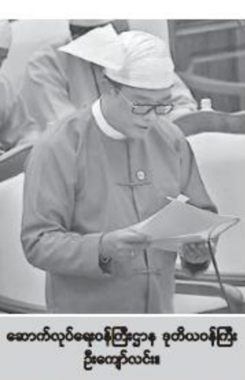
ဆောက်လုပ်ရေးဝန်ကြီးဌာန ဒုတိယဝန်ကြီး ဦးကျော်လင်း။

နေပြည်တော် ၁၅ ဖေဖော်ဝါရီ ၁၄ ဒုတိယအကြိမ် ပြည်သူ့လွှတ်တော် သတ္တမ ပုံမှန်အစည်းအဝေး ၁၇ ရက်မြောက်နေ့ကို ယနေ့နံနက် ၁၀ နာရီတွင် နေပြည်တော်ရှိ ပြည်သူ့လွှတ်တော်အစည်းအဝေးခန်းမ၌ ကျင်းပသည်။ အစည်းအဝေးတွင် ခေါင်းလှန်ဖွဲ့စည်းမှုမှ ဦးအာမိုးခင်၏ ခေါင်းလှန်ဖွဲ့အတွင်းရှိ ပြည်သူ့လွှတ်တော်အမှန်တကယ်လိုအပ်သောလမ်းနှင့် တံတားများ ပြုလုပ်ဆောင်ရွက်ပေးရန် အစီအစဉ် ရှိမရှိ မေးခွန်းနှင့်စပ်လျဉ်း၍ ဆောက်လုပ်ရေးဝန်ကြီးဌာန ဒုတိယဝန်ကြီး ဦးကျော်လင်းက ကချင်ပြည်နယ် ခေါင်းလှန်ဖွဲ့ချုပ်နယ်အတွင်းရှိ မထီဇွင်-ဂျီထုဖန် မြေသားလမ်း ၄ ဖာလုံနှင့် Box Culvert ခုနစ်စင်း၊ မိကော်-ခေါ်ဘူဒဲကျေးရွာချင်းဆက်မြေသားလမ်း ၂ မိုင် ၄ ဖာလုံတို့အား ၂၀၁၈ - ၂၀၁၉ ဘဏ္ဍာနှစ် ပြည်ထောင်စုရန်ပုံငွေဖြင့်လည်းကောင်း၊ မထီဇွင်-ဂျီထုဖန်လမ်း သံကျောက်ခင်းခြင်း လုပ်ငန်း ၆ ဖာလုံတို့အား ၂၀၁၈ - ၂၀၁၉ ဘဏ္ဍာနှစ် ကချင်ပြည်နယ်အစိုးရအဖွဲ့ရန်ပုံငွေဖြင့်လည်းကောင်း ဆောင်ရွက်ပေးရန် ရန်ပုံငွေ