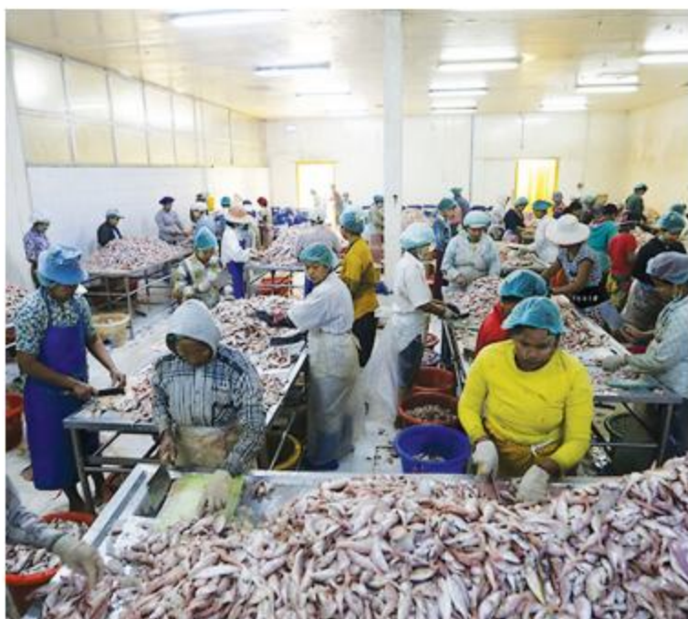
Workers processing fishery products at a cold storage in Hlaingtharya Industrial Zone.