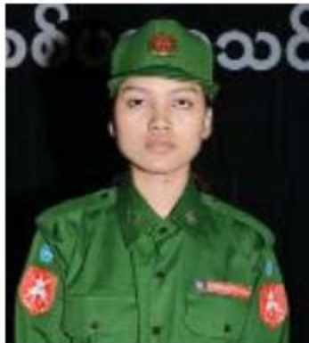
မရွှေစိုးသော်

စာတွေကို ကျောင်းသား၊ ကျောင်းသူတွေကို လက်ဆင့်ကမ်းနိုင်သလို ကျောင်းချိန်ပြင်ပ မှာ ဒီလိုသင်တန်းတွေကို တက်ရောက်ခြင်း အားဖြင့် ကျွန်တော်တို့သည် နောင်လာမယ့် အနာဂတ်မျိုးဆက်သစ် ကျောင်းသား၊ ကျောင်းသူတွေကို ရရှိခွဲအတွေ့အကြုံတွေ လက်ဆင့်ကမ်းပေးနိုင်ဖို့ဆိုတဲ့ ရည်ရွယ်ချက်နဲ့ ဒီသင်တန်းကိုတက်ရောက်ခဲ့ခြင်းဖြစ်ပါတယ်။ လူငယ်တွေအနေနဲ့ မိမိကိုယ်ကိုကာကွယ်နိုင် သလို၊ နိုင်ငံတော်အတွက်လည်း တစ်ဖက် တစ်လမ်းမှ ကာကွယ်နိုင်မယ်၊ ဒါမှလည်း နောင်လာမယ့် မျိုးဆက်သစ်ကျောင်းသား၊ ကျောင်းသူတွေလည်း နိုင်ငံတော်ကာကွယ် ရေးကို ပါဝင်ထမ်းဆောင်နိုင်ပြီး နိုင်ငံသား ကောင်းတစ်ယောက်အနေနဲ့ စစ်သားတစ် ယောက်လို နိုင်ငံတော်ကာကွယ်ရေးအတွက် အမှန်တကယ်တိုက်ခိုက်နေရတာမဟုတ် တောင်မှ နောင်တစ်ချိန် တိုင်းပြည်အတွက် လိုအပ်လာရင် နိုင်ငံတော်ကာကွယ်ရေးအမြင် ကိုသိရှိပြီးတာမှ နိုင်ငံတော်ရံကုရာအခန်း