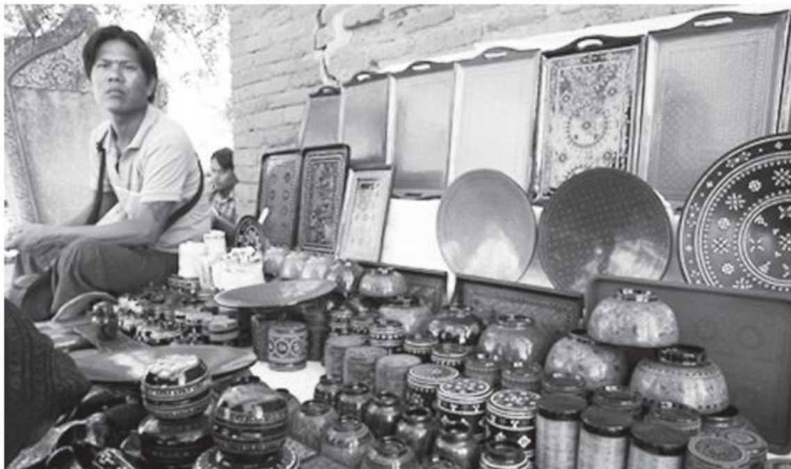
A souvenir shop selling lacquerware at an ancient pagoda in Bagan.

"On 5 February, officials of the governmental departments and members of the Pagoda Board of Trustees hold a meeting at the office of the Nyaung-U District General Administration Department. The meeting decided to relocate the sparse vendors at the