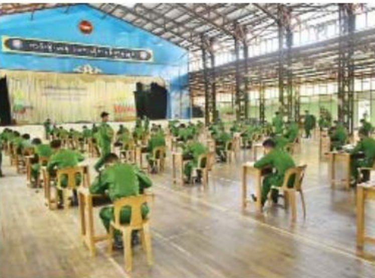
တမ်းရိုးတန်းဒေသတိုင်းစစ်ဌာနချုပ်၏ (၇၃)နှစ်မြောက် တပ်မတော်နေ့အထိမ်းအမှတ် ဗဟို အဆင့် စစ်သည်တော်ကျင့်ဝတ်ပြိုင်ပွဲ ကျင်းပစဉ်။

နေပြည်တော် ၀၈ဖော်ဝါရီ ၁၄ တမ်းရိုးတန်းဒေသတိုင်းစစ်ဌာနချုပ်၏ (၇၃)နှစ်မြောက် တပ်မတော်နေ့အထိမ်းအမှတ် ဗဟိုအဆင့် စစ်သည်တော်ကျင့်ဝတ်ပြိုင်ပွဲကို ဖေဖော်ဝါရီ ၁၃ ရက် နေ့လယ်ပိုင်းတွင် တိုင်း ရန်အောင်ခန်းမ၌ပြုလုပ်ရာ အရာရှိ၊ စစ်သည် များ၏ စစ်သည်တော်ကျင့်ဝတ်ပြိုင်ပွဲ ပြေဆို နေမှုများကို တိုင်းမှူး ဗိုလ်ချုပ်လင်းအောင် နှင့်အဖွဲ့ဝင်များက သွားရောက်ကြည့်ရှုအား မေးခဲ့ကြောင်း သတင်းရရှိသည်။ (၁၀၀)