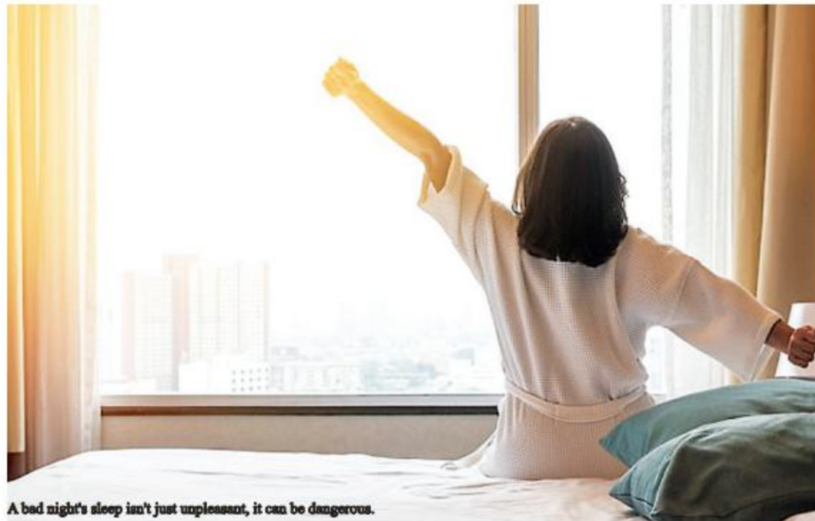
A bad night's sleep isn't just unpleasant, it can be dangerous.