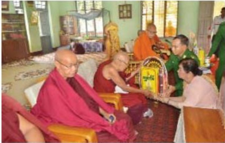
သံဃာတော်များထံ တောင်ပိုင်းတိုင်းစစ်ဌာနချုပ် တိုင်းမှူး ဗိုလ်ချုပ်မြတ်ကျော် သက်နိုးနှင့် လှူဖွယ်ပစ္စည်းများ ဆက်ကပ်လှူဒါန်းစဉ်။

နေပြည်တော် ၀၈ဖော်ဝါရီ ၁၄ ပဲခူးတိုင်းဒေသကြီး၊ တောင်ငူမြို့၊ မြစည်းခုံ စာသင်တိုက် (၄၉)ကြိမ်မြောက် တောင်ငူ ခရိုင်လုံးဆိုင်ရာ သုဓမ္မာပရိယတ္တိစာမေးပွဲ ဝင်ရောက်ပြေဆိုတော်မူကြသည့် သံဃာတော် အရှင်သုမြတ်များအား နေဆွမ်းသက်ကပ်လှူဒါန်းခြင်းကို ဖေဖော်ဝါရီ ၁၃ ရက် နံနက် ပိုင်းတွင် အဆိုပါစာသင်တိုက်ပြုလုပ်ရာ ကြာနီကန်ကျောင်းတိုက် ဦးစီးပဓာနနာယက ဆရာတော် အဂ္ဂမဟာပဏ္ဍိတ မဟာဂန္ထဝါစက ပဏ္ဍိတ အဂ္ဂမဟာဂန္ထဝါစကပဏ္ဍိတ ဘဒ္ဒန္တ သူရိယအမျှော်ပြသော သံဃာတော်များ ကြွ ရောက်တော်မူကြပြီး တောင်ငူတိုင်းစစ်ဌာနချုပ် တိုင်းမှူး ဗိုလ်ချုပ်မြတ်ကျော်နှင့် အရာရှိ၊ စစ်သည်၊ မိသားစုများ၊ စေတနာရှင်အလှူရှင် များနှင့် ဖိတ်ကြားထားသူများ တက်ရောက်ကြ သည်။ ဦးစွာ တိုင်းမှူးနှင့် တက်ရောက်လာကြ သူများက ကြာနီကန်ကျောင်းတိုက်ဆရာတော် ထံမှ ငါးပါးသီလခံယူဆောက်တည်ကြပြီး နောက် သံဃာတော်များ၏ ပရိတ်တရားတော် ရွတ်ပွားမှုများကို နာယူကြသည်။ ယင်းနောက် တိုင်းမှူးနှင့် တက်ရောက်လာ ကြသူများက သံဃာတော်များအား သက်နိုး နှင့် လှူဖွယ်ပစ္စည်းများ ဆက်ကပ်လှူဒါန်း ကြပြီး တောင်ငူခရိုင်အတွင်းရှိ စာသင်တိုက်