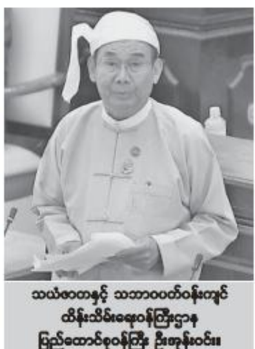
သယ်ယူပို့ဆောင်ရေးနှင့် သဘာဝပတ်ဝန်းကျင် ထိန်းသိမ်းရေးဝန်ကြီးဌာန ပြည်ထောင်စုဝန်ကြီး ဦးဟန်ဝင်း။

နိုင်ငံသား အလုပ်သမားများသည်လည်း နိုင်ငံကူးလက်မှတ်များ တရားဝင်ထုတ်ပေးပြီး တရားဝင်လမ်းကြောင်းမှ စေလွှတ်လျက်ရှိကြောင်း၊ အထောက်အထားတင်ပြနိုင်ခြင်းမရှိသည့် မြန်မာနိုင်ငံသားများကိုလည်း မြန်မာသံမှူးက မြန်မာနိုင်ငံသို့ ပြန်လာနိုင်ရန်အတွက် C of I များ ထုတ်ပေးလျက်ရှိကြောင်း၊ C of I များသည် နိုင်ငံကူးလက်မှတ်ကဲ့သို့ အသုံးပြုနိုင်ရန်အတွက် သတ်မှတ်ပြဌာန်းချက်နှင့် ဆန့်ကျင်ပြီးမှ မလေးရှားအစိုးရနှင့် တွေ့ဆုံဆွေးနွေးပြီး အသိအမှတ်ပြုလက်မှတ် (Certificate of Identity) ပြုလုပ်ပေးရန် အစီအစဉ် မရှိကြောင်း ရှင်းလင်းဖြေကြားသည်။ ကချင်ပြည်နယ်မဲဆန္ဒနယ်အမှတ်(၁၂)မှ စောယွားဖောင်အွာနှင့် တနင်္သာရီတိုင်းဒေသကြီး မဲဆန္ဒနယ်အမှတ်(၄)မှ ဦးဟန်ဝင်းသိန်း၏ ထားဝယ်အထူးစီးပွားရေးဇုန် (Dawei SEZ) ဒေသအတွင်းရှိ ကျေးရွာများနှင့် လယ်ယာဥယျာဉ်ခြံမြေများကို အထူးစီးပွားရေးဇုန်စီမံကိန်း ပြန်လည်အကောင်အထည်ဖော်ကာ ဒေသခံပြည်သူများအား ပြောင်းရွှေ့နေရာချထားပေးနိုင်သောမိကာလအတွင်း ထိုဒေသကို အခြားဒေသကျေးရွာများနည်းတူ ဖွံ့ဖြိုးရေးလုပ်ငန်းများကို စဉ်ဆက်မပြတ်ဆောင်ရွက်ပေးနိုင်ခြင်းရှိ၊ မရှိ၊ စီမံကိန်းနှင့်ပတ်သက်သောကိစ္စရပ်များနှင့် အစည်းအဝေးများတွင် မဲဆန္ဒနယ်မြေရှိ လွှတ်တော်ကိုယ်စားလှယ်များကို ဖိတ်ကြားခြင်း၊ အသိပေးပါဝင်စေနိုင်ခြင်းရှိ၊ မရှိ မေးခွန်းနှင့်စပ်လျဉ်း၍ စီးပွားရေးနှင့် ကူးသန်းရောင်းဝယ်ရေးဝန်ကြီးဌာန ဒုတိယဝန်ကြီး ဦးအောင်ထူးက ထားဝယ်အထူးစီးပွားရေးဇုန်၏ ကနဦးစီမံကိန်း အကျယ်အဝန်း စက ၁၀၃၇၃ စက ရှိပြီး လျော်ကြေးပေးရမည့် ၉၈၉၇ စကအနက်