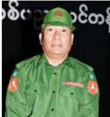
ဦးစာင်တို့တို့

ကျွန်တော်က လက်ရှိနေထိုင်နေဆိုင်ရာ ဆေးတက္ကသိုလ်မှာလက်ထောက်ကထိက တာဝန်ထမ်းဆောင်ပါတယ်။ ကျွန်တော့်အနေ နဲ့ နိုင်ငံသားတစ်ယောက်အနေနဲ့ နိုင်ငံတော် ကာကွယ်ရေးတာဝန်တွေမှာ ပါဝင်သင့် တယ်ဆိုတဲ့ရည်ရွယ်ချက်၊ တက္ကသိုလ်အချိန် လေ့ကျင့်နေတပ်ကို တက်ရောက်ခြင်းဖြင့် ကျောင်းဆရာတစ်ယောက်ဖြစ်တဲ့အားလျော် စွာ စာသင်ခန်းထဲမှာ ပညာပိုင်းဆိုင်ရာ ဗဟုသုတနဲ့ ကျွန်တော်တို့ချစ်ခင်တဲ့ သင်ခန်း