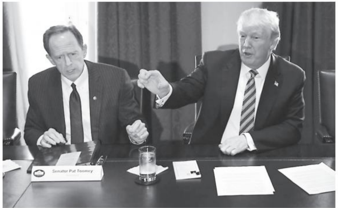
U.S. President Donald Trump speaks while Sen. Pat Toomey, a Republican from Pennsylvania, listens during a meeting with bipartisan members of Congress on trade in the Cabinet Room of the White House in Washington on Tuesday.

"I will make a decision that reflects the best interests of the United States, including the need to address overproduction in China and other countries," he said.