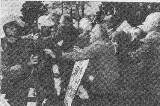
Τα ρόπαλα των ΜΑΤ στο προσκήνιο

δικαίωμα στην επιβίωση, υπερασπίζονται τη μεγάλη κατάκτηση της εργατικής τάξης, την ίδια την Κοινωνική Ασφάλιση. Τολμού, είπαν, να μιλήσουν για ελλείμματα των ασφαλιστικών ταμείων, όταν επί χρόνια τα αποθεματικά των ταμείων δεσμεύονταν υποχρεωτικά από τις τράπεζες με χαμηλό επιτόκιο. Μόνο για το ΙΚΑ οι εργοδότες και το κράτος έχουν υπεξαιρέσει 7 τρις. δραχμές χρήματα των εργαζομένων.