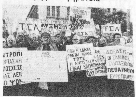
Οχι στις συντάξεις πείνας, όχι στην πολιτική της ευρωποταγής

Οι Συνταξιούχοι όλων των Ταμείων, μέσα από τη Συντο-