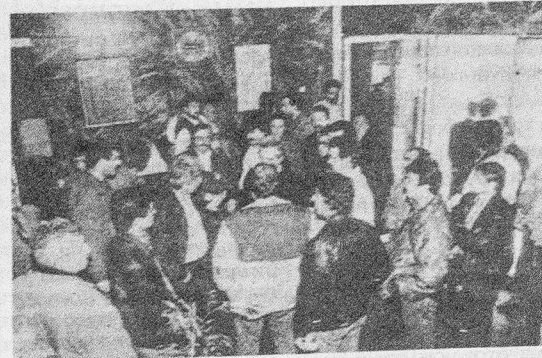
Διάβημα συνδικαλιστών στο ΥΕΝ για τις απαράδεκτες παρεμβάσεις του υπουργού στο Ναυτεργατικό Σ.Κ.

δοι, πράγμα το οποίο καθορίζεται από τις διαπιστώσεις. Αυτές οι πολιτικές και συνδικαλιστικές δυνάμεις που αποδέχονται και σπρίζουν αυτή την Ευρωπαϊκή προοπτική, που ισχύει το δικαίωμα του ισχυρότερου και όχι όπως ψευδέστατα προπαγαν-